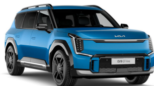
Ocean Blue [OBG] Glossy metallic (GT Line)