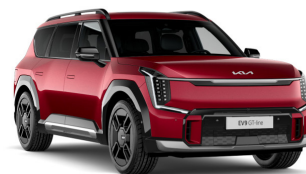
Flare Red [C7R] metallic