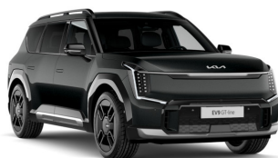
Aurora Black Pearl [ABP] metallic (pearleffekt)