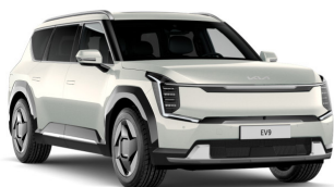
Ivory Silver [ISG] metallic (ej GT Line)