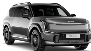
Pebble Gray [DFG] metallic