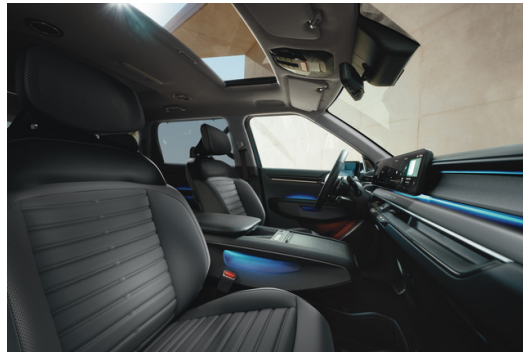
EV9 Plus Veganläder Svart/Grå Quiltad