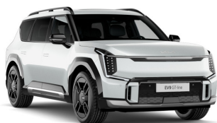
Snow White Pearl [SWP] metallic (pearleffekt)