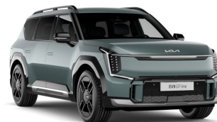
Iceberg Green [IEG] metallic