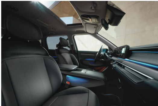
EV9 Veganläder Svart/Grå