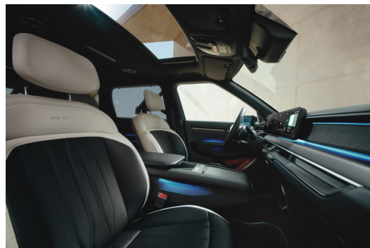
GT LINE Veganläder Vit/Svart