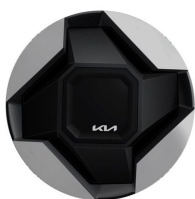
EV9 & EV9 Plus 19" aluminiumfälgar med aerodynamisk hjulsida 255/60 R19