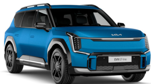
Tillval: Ocean Blue [OBM] matt (GT Line)