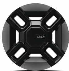
EV9 GT Line 21" aluminiumfälgar med aerodynamisk hjulsida 285/45 R21